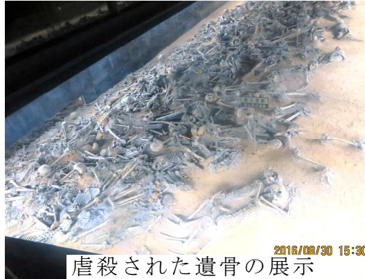
虐殺された遺骨の展示

撫順炭鉱から1時間程移動して、「平頂山惨案記念館」に到着。中国人の撫順炭鉱襲撃行為の報復作戦として平頂山集落を襲撃し3000人の部落民を虐殺した平頂山事件資料が展示されている所です。 入ると、平頂山周辺の立体模型ジオラマがあり、事件が起きた位置関係が分かる様になっていました。そこを通り過ぎ、目の前に現れたのが、