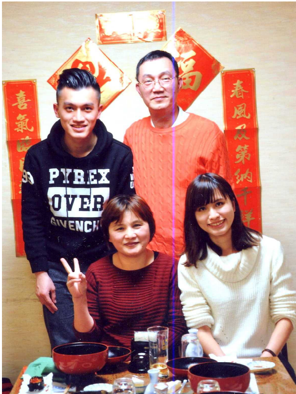
台湾の訪問客—日本料理店で旧正月をお祝い

今回の来訪者は、当時の技術者の中の一家族です。北海道は初めてとの事でしたが、私の出来る範囲で観光のお手伝いをしました。札幌、小樽、支笏湖などを案内しました。