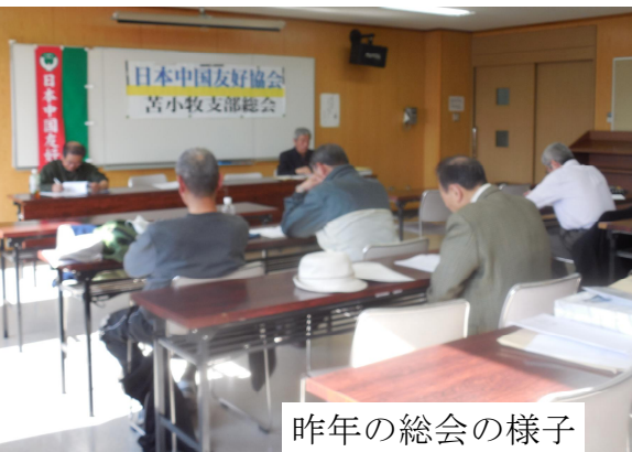
昨年の総会の様子

4月9日 日中友好協会苦小牧支部の総会を行います 会場は、市民活動センター 2階研修室 DVDの上映 「南京事件」兵士たちの遺言