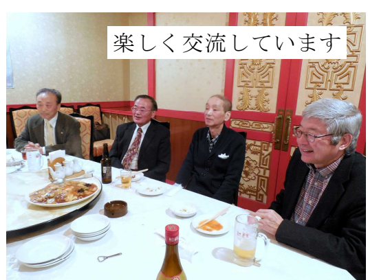
楽しく交流しています

中華料理を味わいながら、話がはずみました。乾杯が始まり、一人一人が自己紹介しながら、それぞれの思いを語り合いました。日中友好協会との出会い、中国語教室の様子、中国で留学の話、蓬萊との関わりや中華料理のことなど、苦小牧支部の活動のことなど、紹興酒で、ほどよく酔いが回り、気持ちも良くなつて、さらに話がはずんでいきました。それぞれが、いましてい