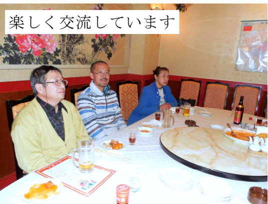
楽しく交流しています

日中友好協会との出会い、中国語教室の様子、中国で留学の話、蓬萊との関わりや中華料理のことなど、苦小牧支部の活動のことなど、紹興酒で、ほどよく酔いが回り、気持ちも良くなつて、さらに話がはずんでいきました。それぞれが、いましてい