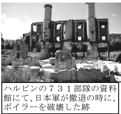
ハルピンの731部隊の資料館にて、日本軍が撤退の時に、ボイラーを破壊した跡

・中国侵略戦争で、日本は何をしたのか ※現地でも撮ったビデオと写真を使って説明。 ※参加したみなさんのひと言をいただきます。交流をすすめます。